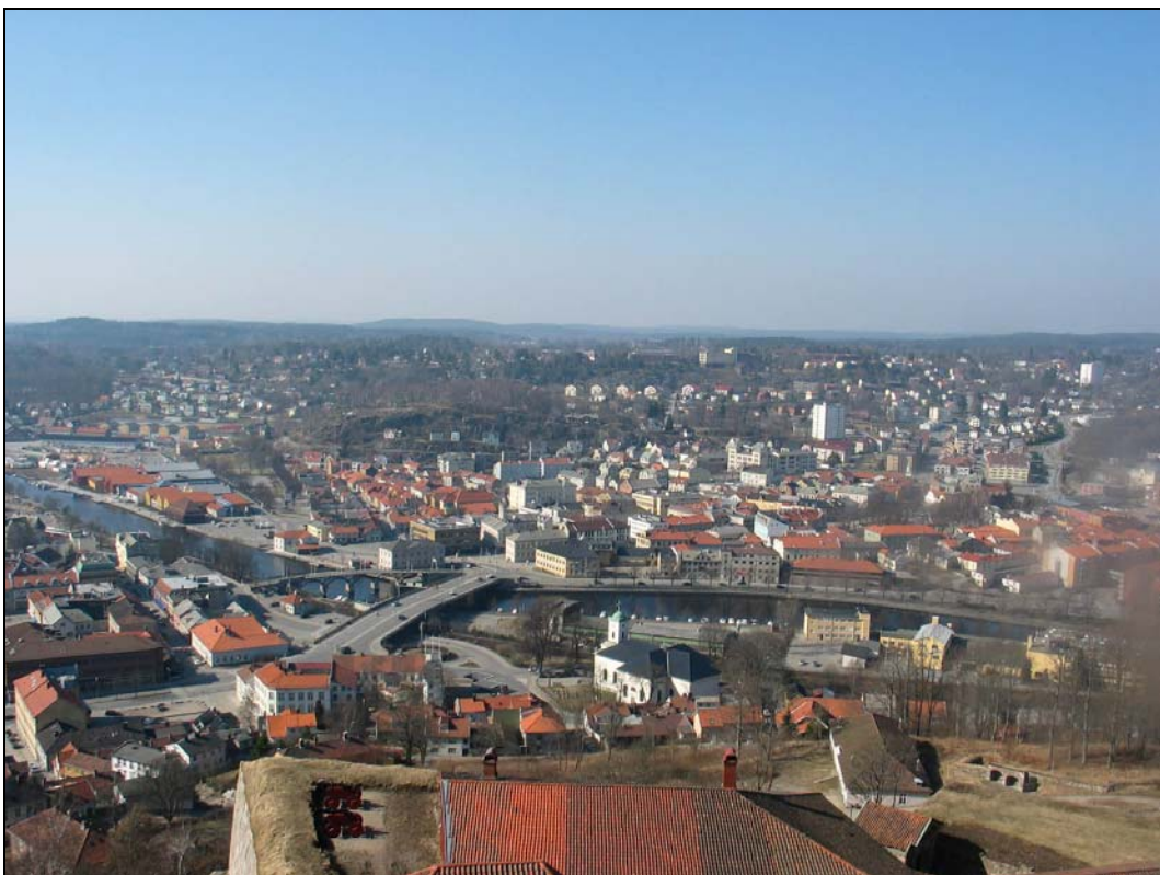
Halden i Østfold, 3. april.

Månedstemperaturen for april var godt over normalen i hele landet. Størst temperaturavvik fikk indre deler av Troms, der månedstemperaturen var opp til 3,2 grader over normalen. Det var store nedbørforskjeller mellom landsdelene. Månedsnedbøren i deler av Finnmark, Hordaland og Sogn og Fjordane var to til tre ganger større enn normalen, mens enkelte deler av Oppland og Hedmark bare fikk 20-40 % av normalen.