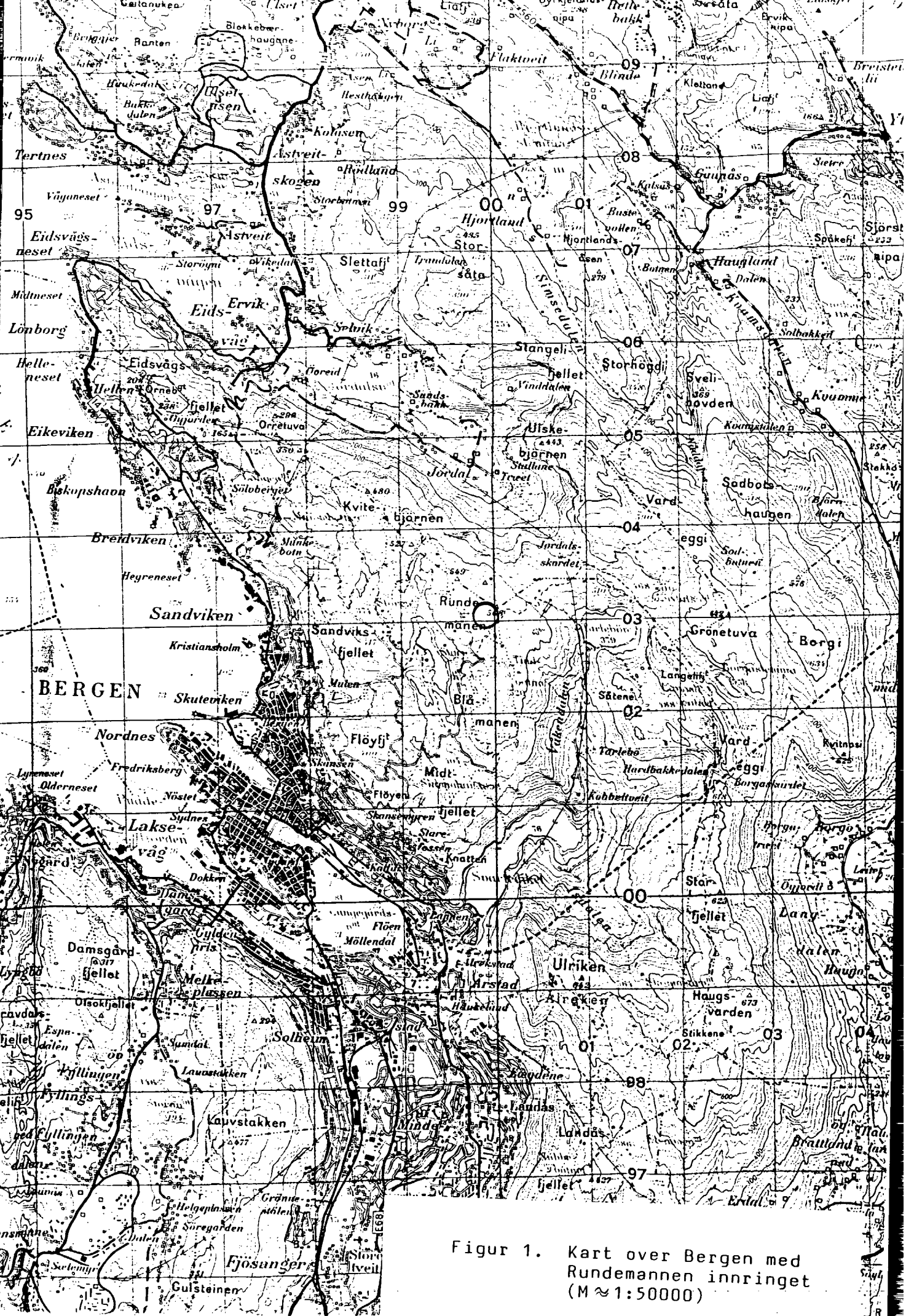
Figur 1. Kart over Bergen med Rundemennene innringet (M ≈ 1:50000)