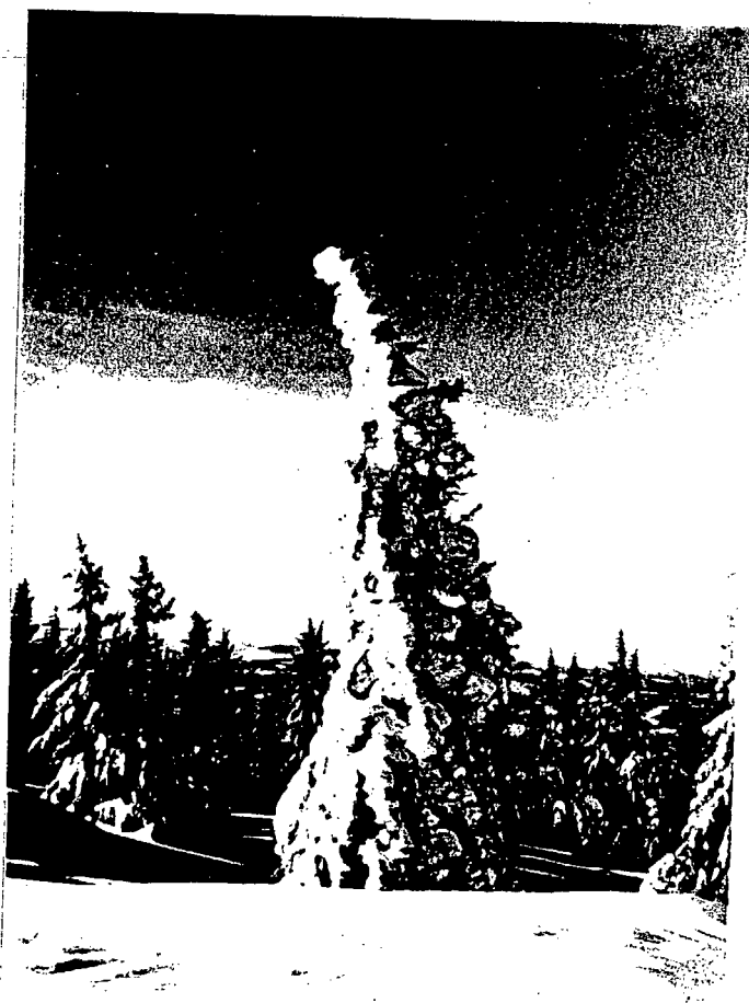
Figur 2. Grantre med is ved mast 263.