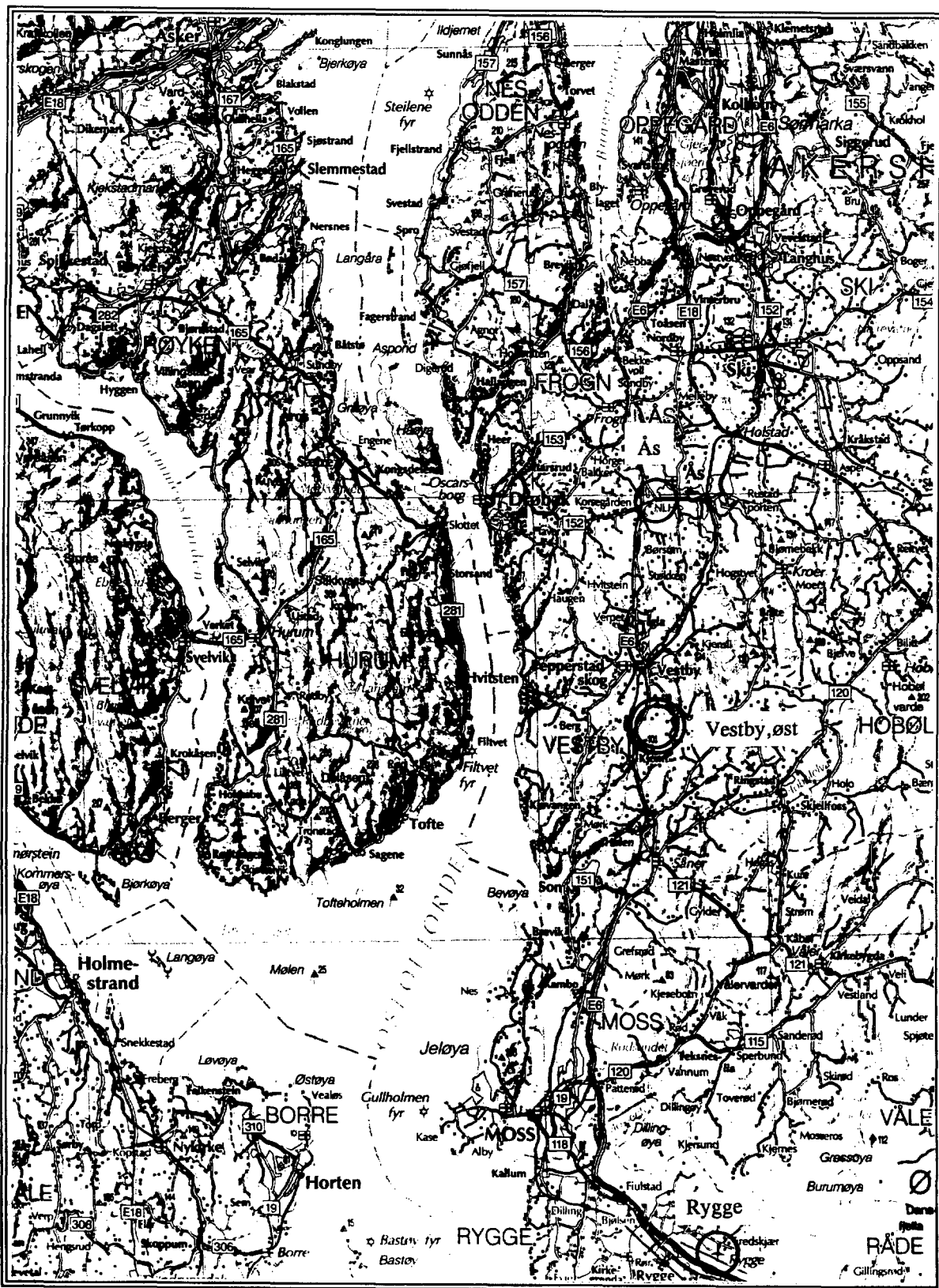
Figur 2.2. Beliggenheten av Vestby, alternativ øst.